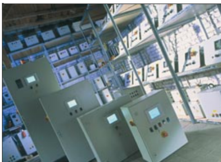
Schaltanlagen in allen Leistungsdimensionen

Ihre Steuerung wird je nach Leistung, Sensoren und Zubehör individuell für Ihren Einsatzfall zusammengestellt.