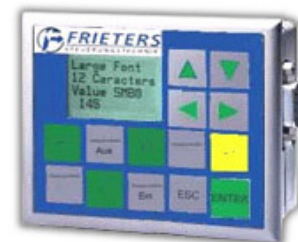
Kundenspezifisches Spezialdisplay für Absauganlagen mit Hintergrundbeleuchtung. Sie erhalten das Display mit Ihrem Firmenlogo und Ihrer Farbe ohne Aufpreis bereits ab 1 Stück.